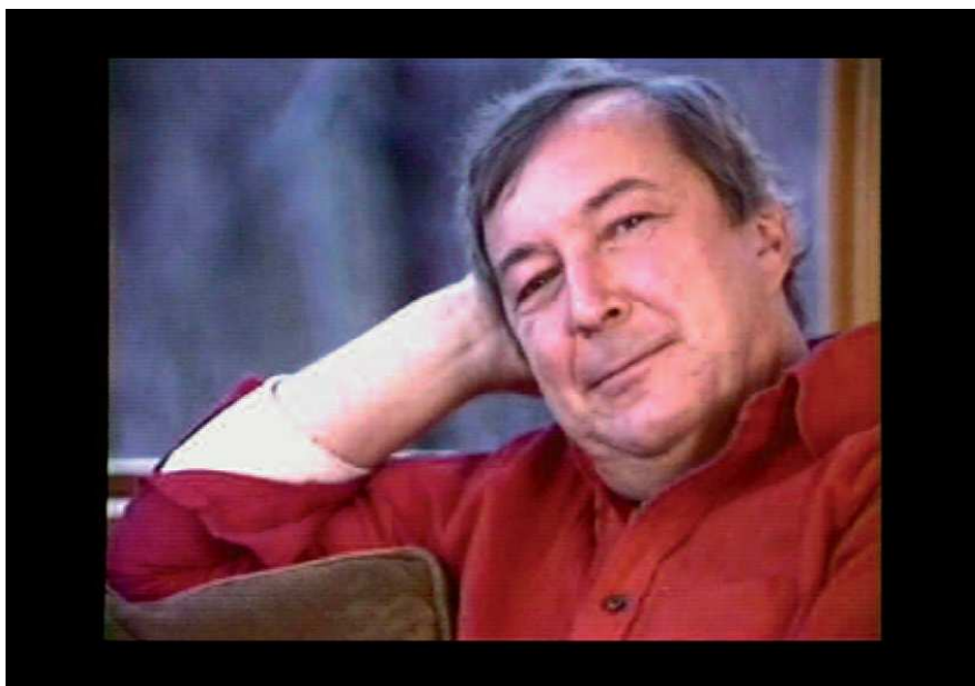
Jasper Johns 1978