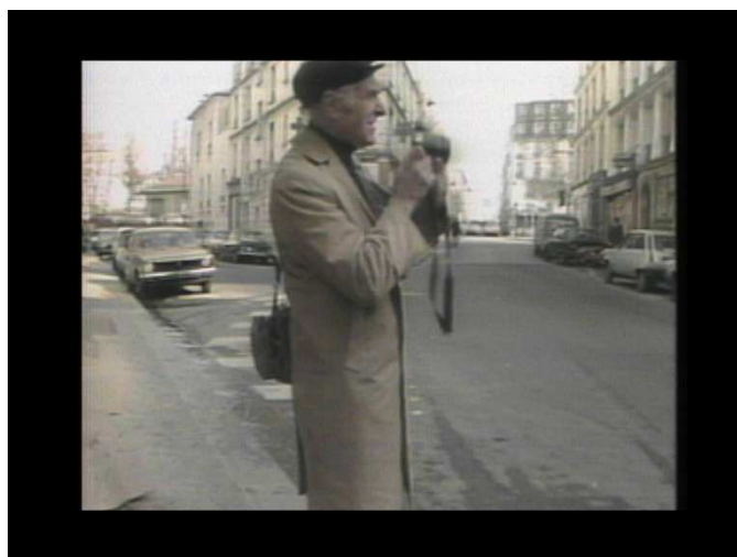
Robert Doisneau 1983, © Joan Logue